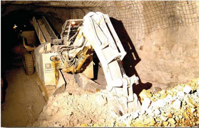
The machine ITC 312 im vollen Einsatz