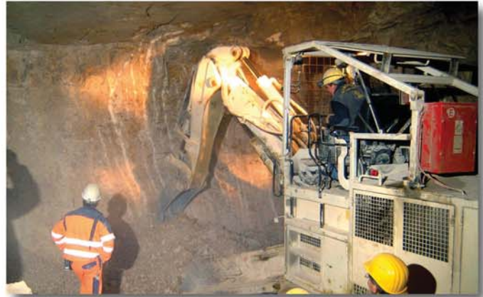
Berauben der Orstbrust in sehr sicheren Bedingungen