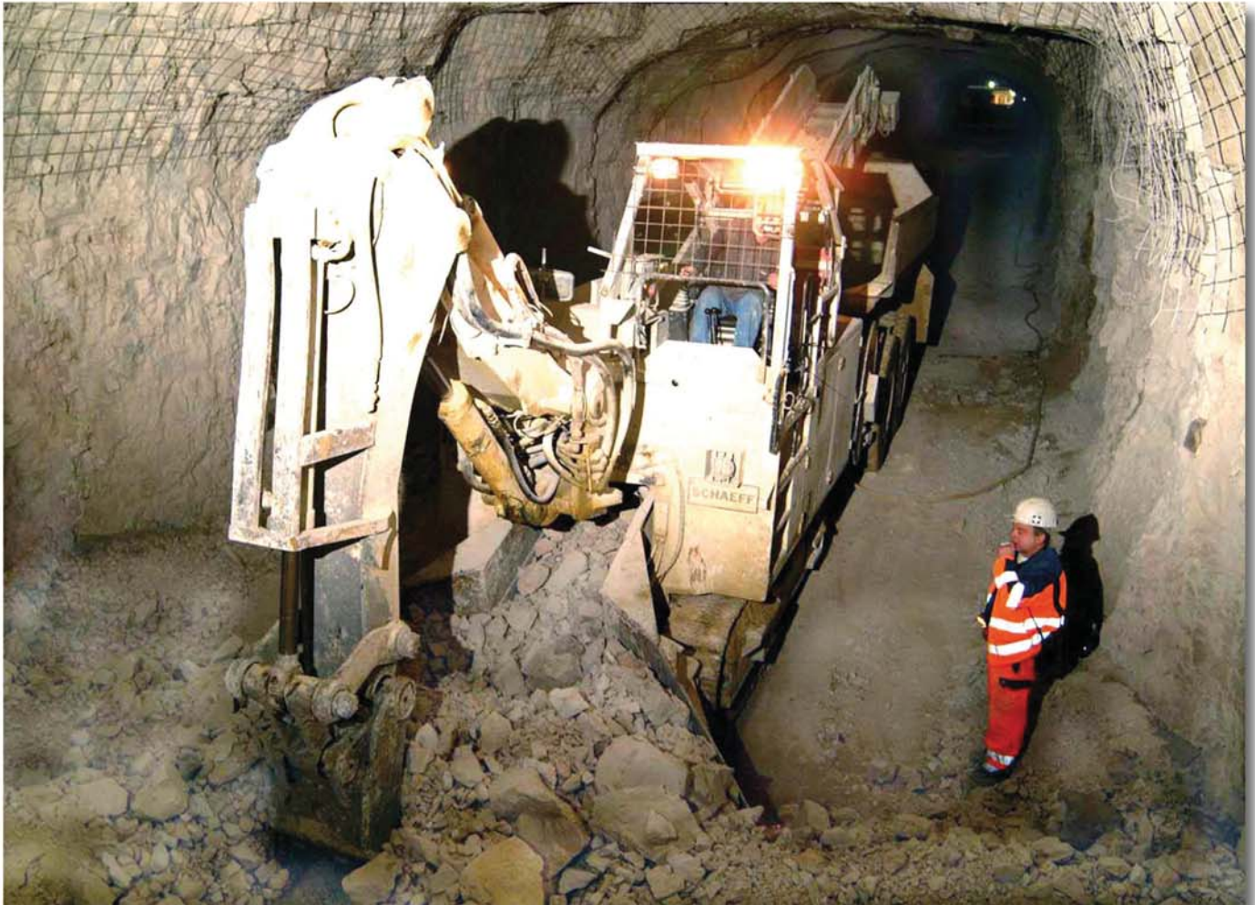
Die Tunnellademaschine Typ ITC 312 H3 in Ladeposition im Hauptstollen