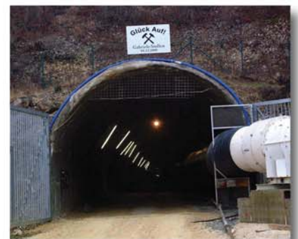
Eingang zum Gabriele-Stollen