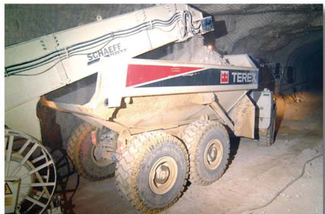
Loading on Dumper Terex TA 35