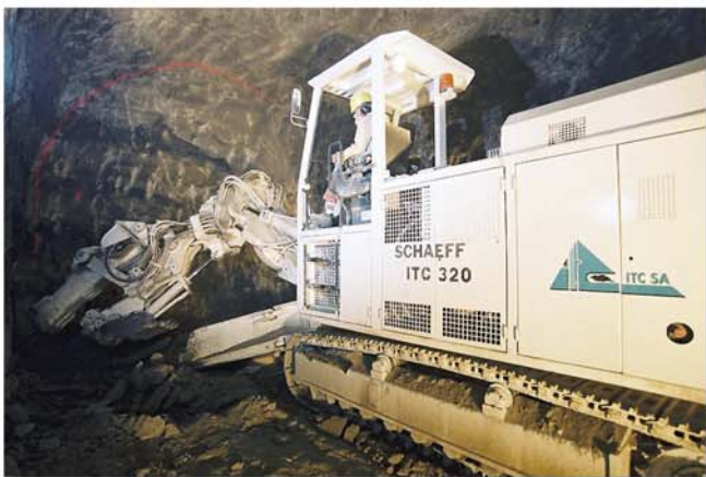
Präzise Arbeit dank Kipp- und Schwenkkonsole