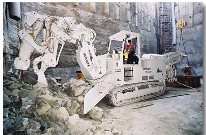
Überladen auf Kranskipps