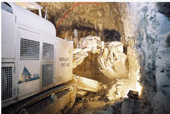
Präzises Profilieren des Querschnittes