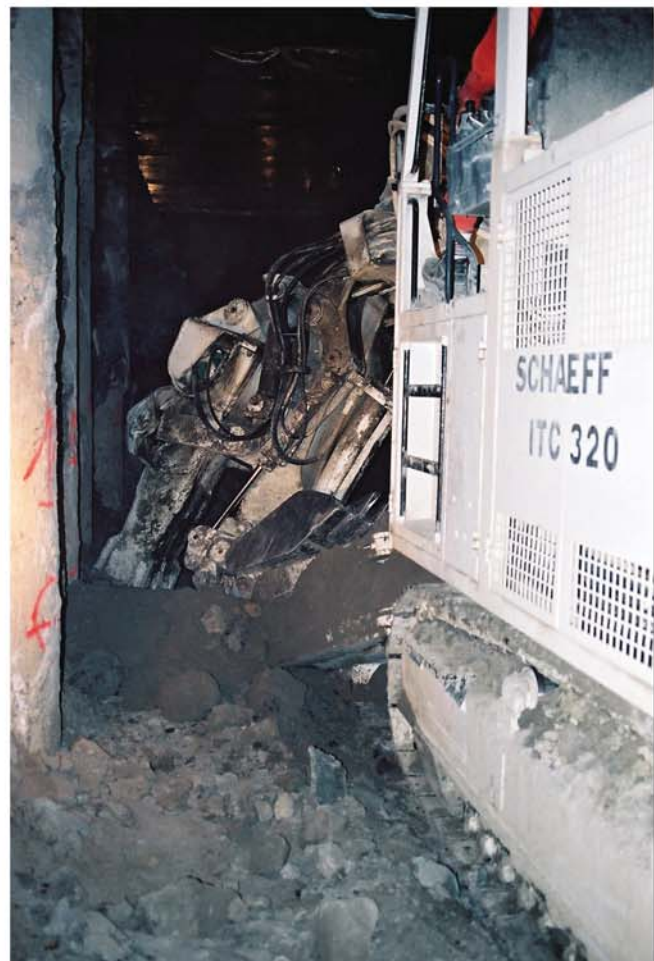
Räumen der Sohle zum Aufsetzen der Stahlbögen