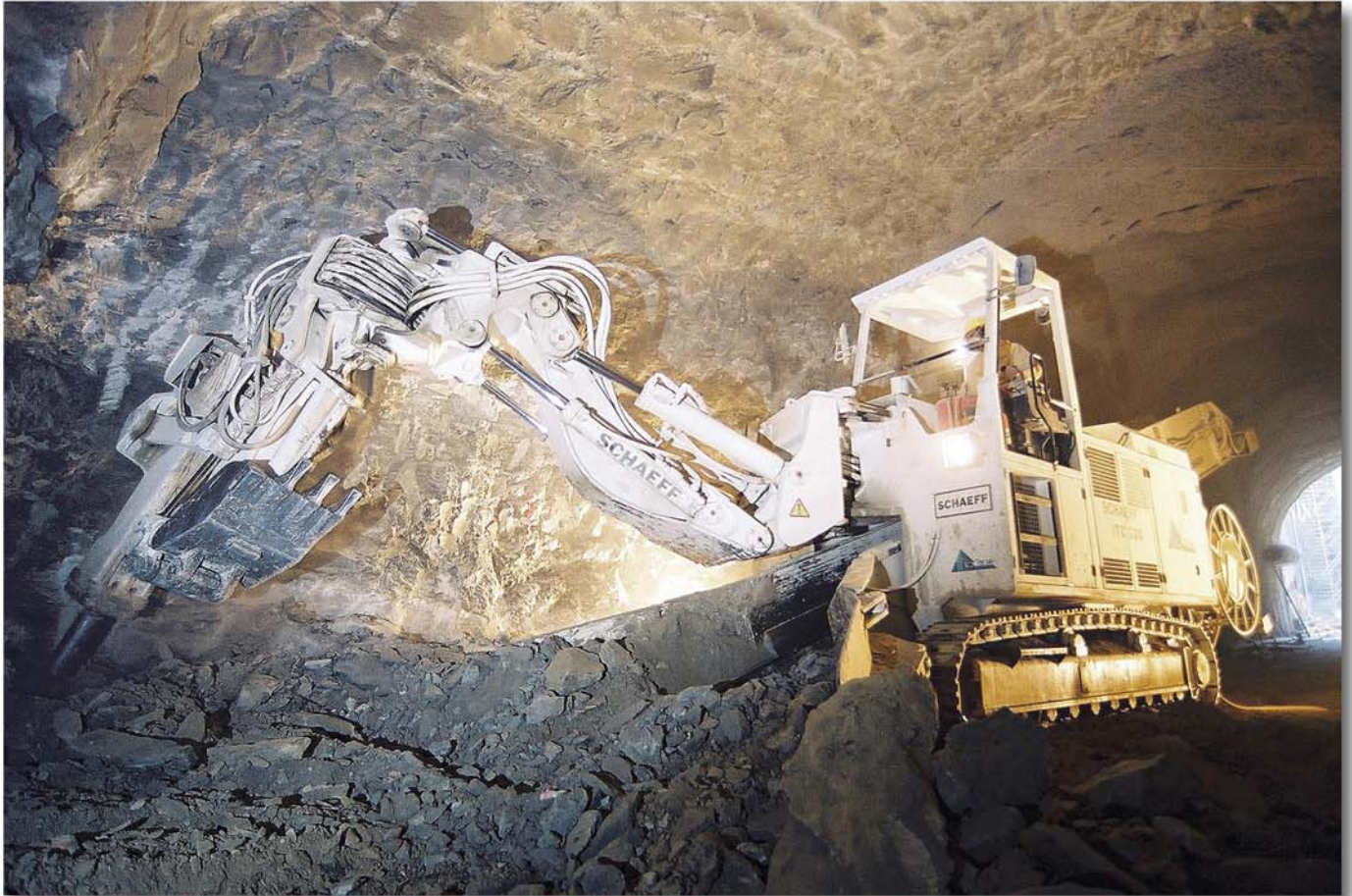
Die Tunnelvortriebs- und Lademaschine Schaeff Typ ITC 320 produziert grössere Brocken und wenig Staub