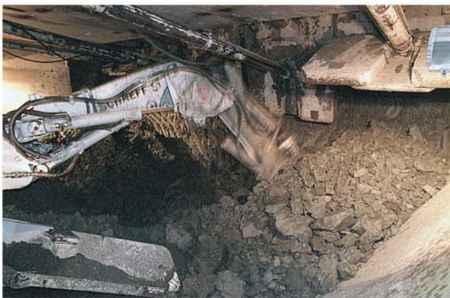
Lösen und Laden in der unteren Hälfte des Schildes