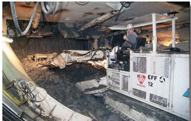
Hohe Leistung erfreut nicht nur den Operator