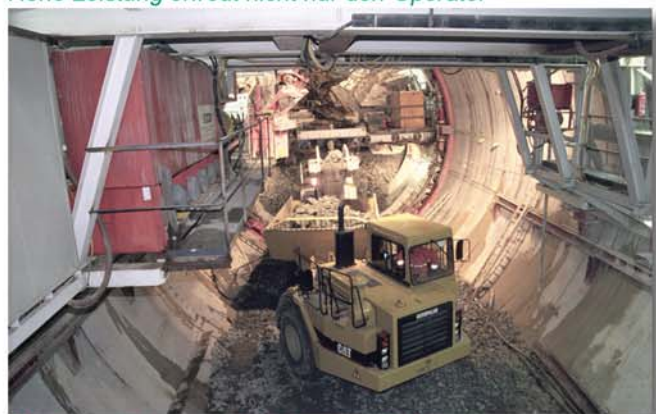
Ausbau mittels vorgefertigter Betontübbinge