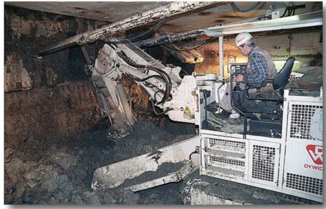
Arbeitseinrichtung mit Kippkonsole für niedrige Arbeitshöhe