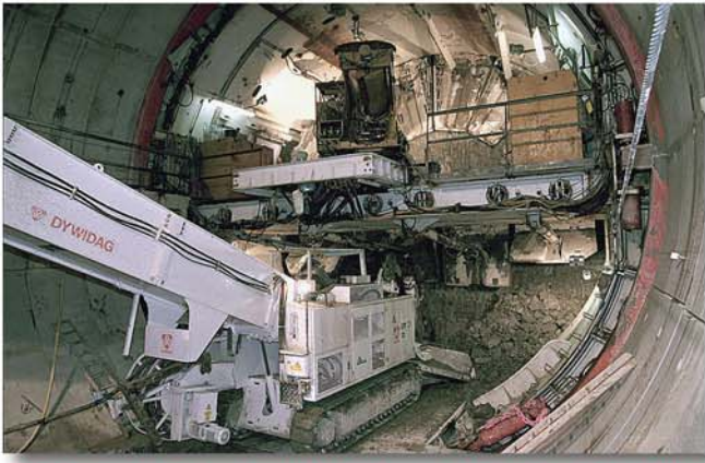
Arbeiten in sehr niedrigen Verhältnissen unter der Mittelbühne