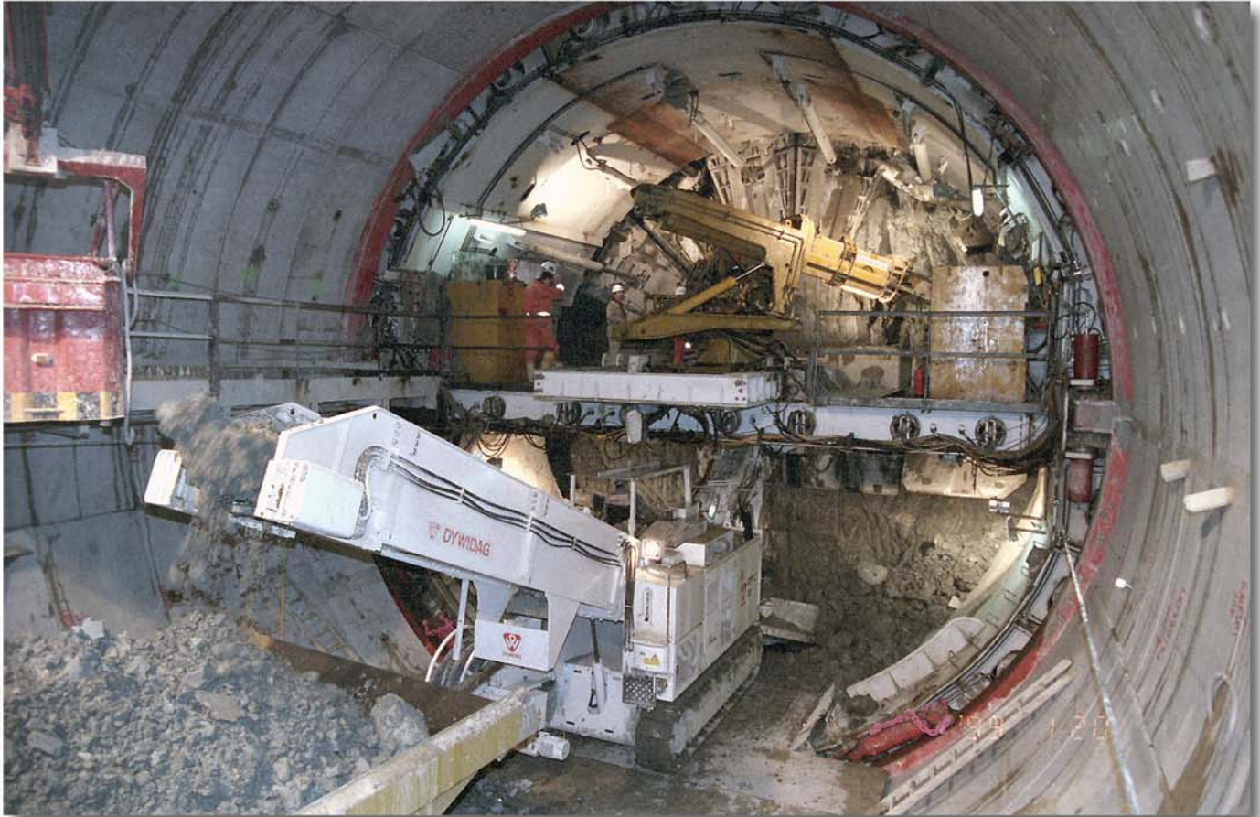
Die Tunnelvortriebs- und Lademaschine Schaeff Typ ITC 312 in einem Vortriebsschild \varnothing 11,46 m mit Tübbingausbau