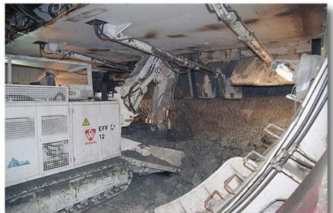
Wegladen des vom oberen Stationärbagger gelösten Materials