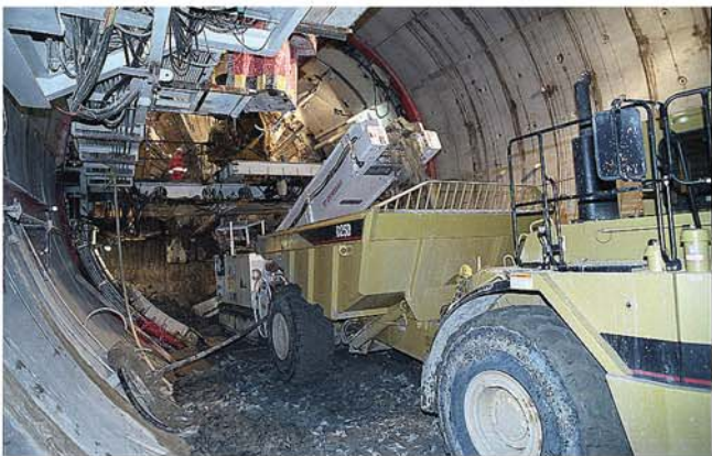
Überladen auf 25 t - Muldenkipper