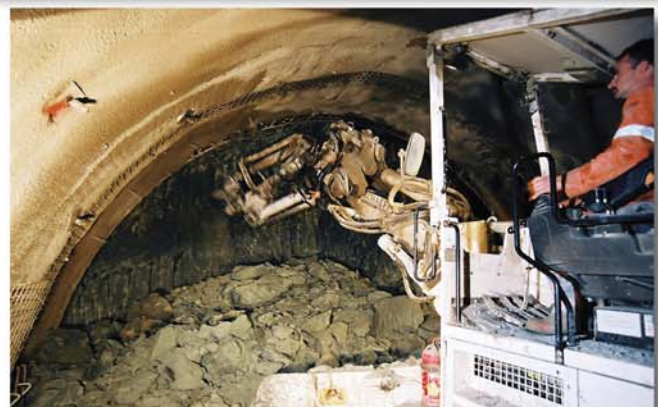
Profilgenauer Ausbruch dank Kipp-Schwenkkonsole