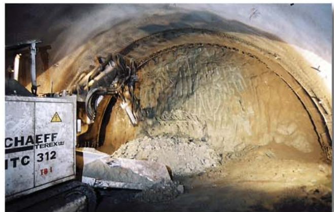
Abbau der linken Kalottenseite