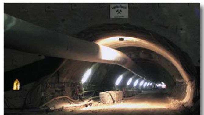
Ostportal: Angelika-Tunnel, links die Schutzpatronin Barbara