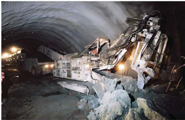
Schneller Ladevorgang auf 30-to- Muldenkipper