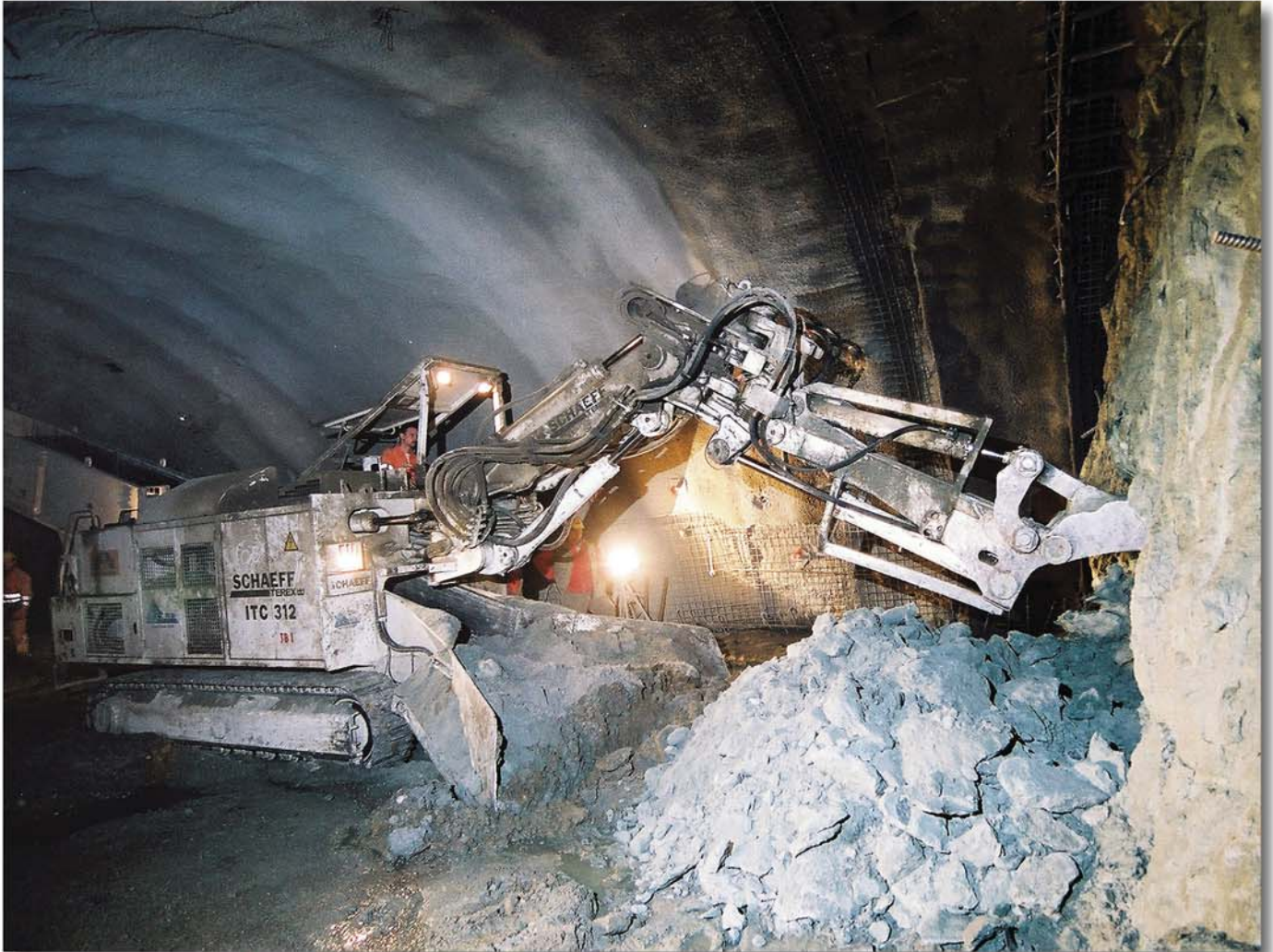
Kalottenvortrieb in harten Schlufftonlagen