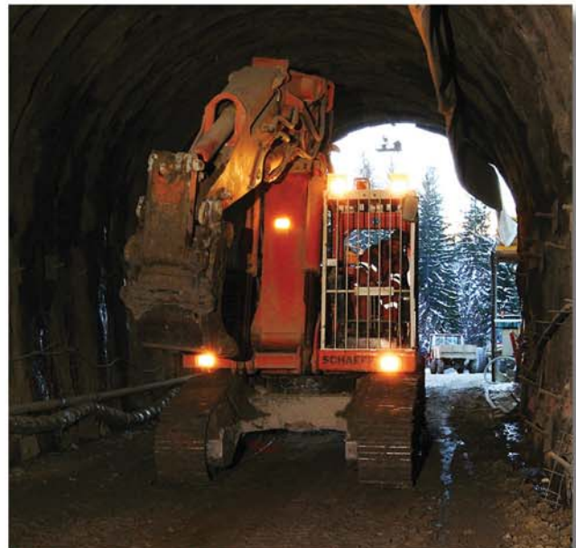
Der Tunnelbagger fährt zum Einsatz