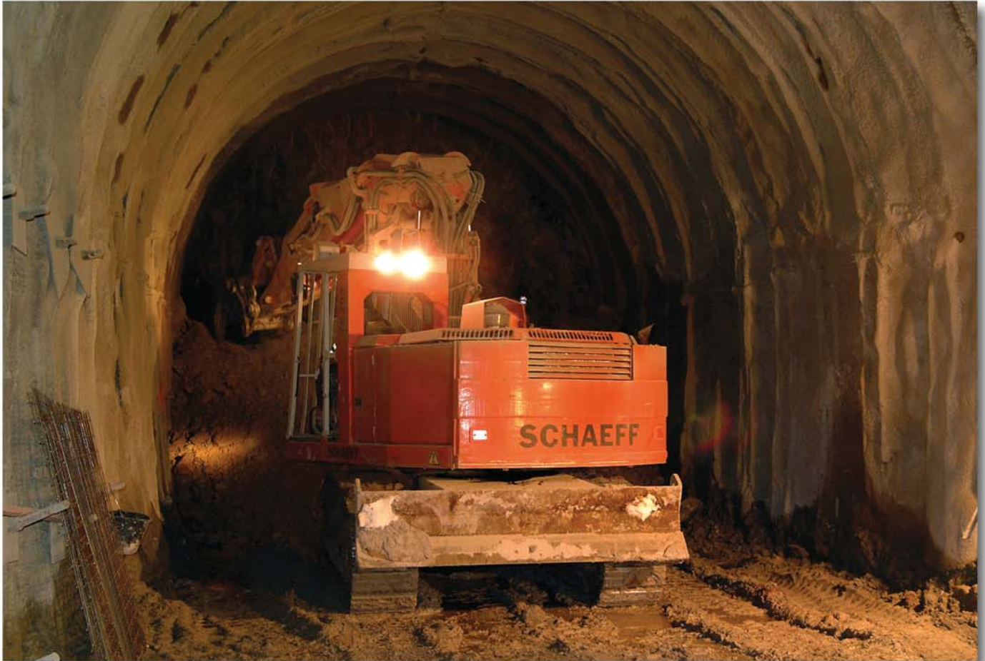
Der Tunnelbagger Typ TE 200 im Tunnelquerschnitt 37 m 2 , Firsthöhe 6 m