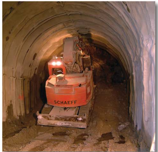
Der Tunnelbagger TE 200 steigt auf das Haufwerk zum Bereissen der Firste