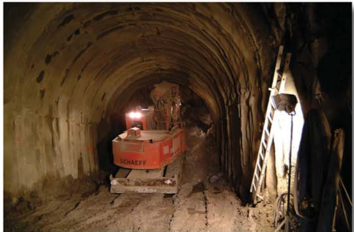
Der Tunnelbagger TE 200 beim Ausbaggern der Kalotte