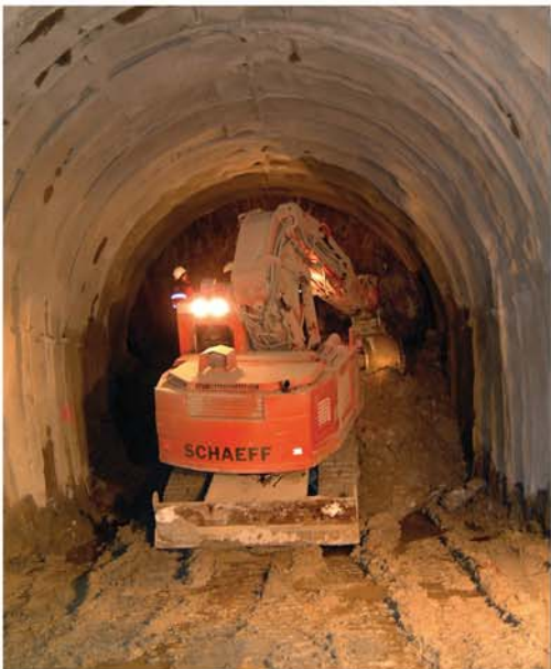
Der Tunnelbagger TE 200 beim Ulmenausbruch