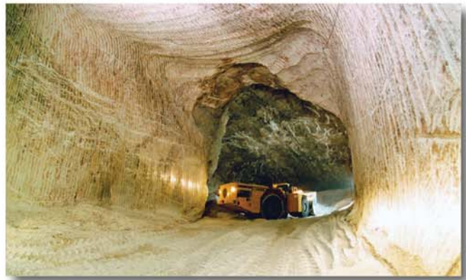
Der Paus Fahrlader PFL 30 in dem Querschnitt