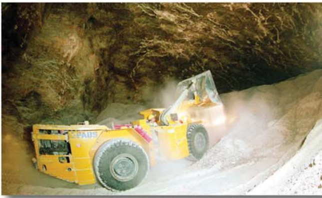
Der Paus Fahrlader PFL 30 bei Materialverschiebung