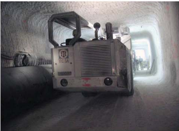
Der Muldenkipper N° 1