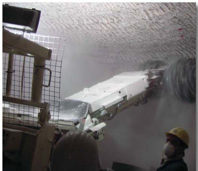
Die schwere Teilschnittmaschine fräst den Salz kontinuierlich