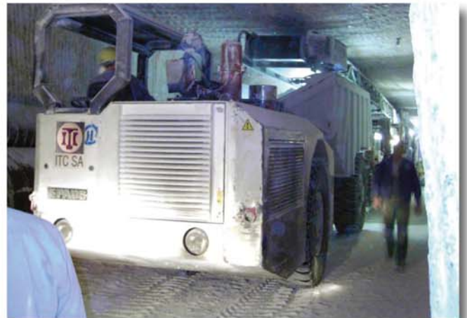
Der Muldenkipper N° 2