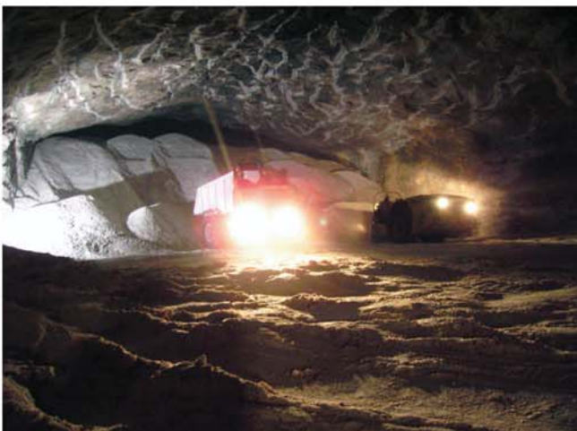
Die Riesenkavernen werden mit dem Schuttermaterial gefüllt