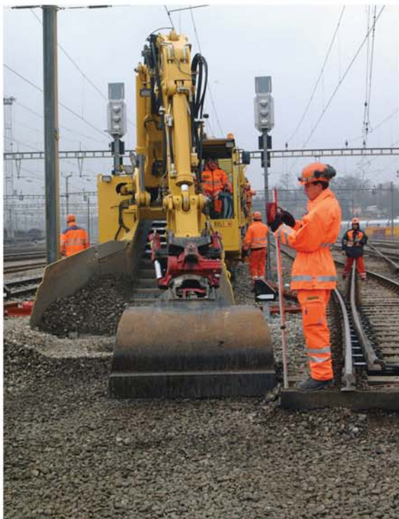
Genaueres Arbeiten dank Roto-Tilt Einrichtung