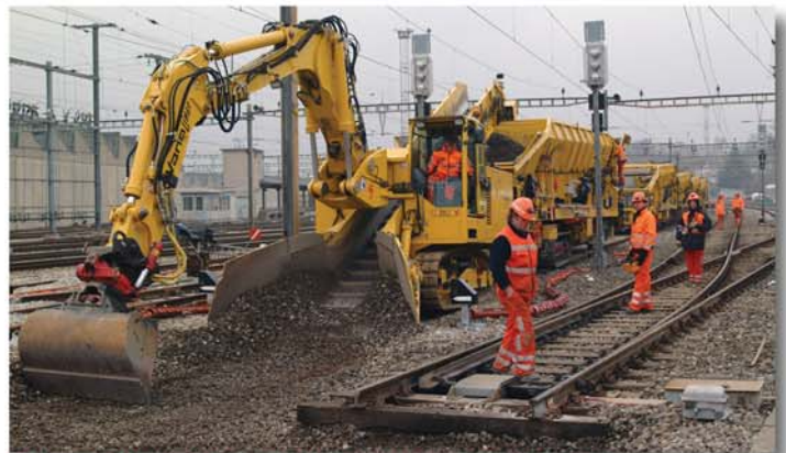
Geringer Platzbedarf dank integriertem Förderband