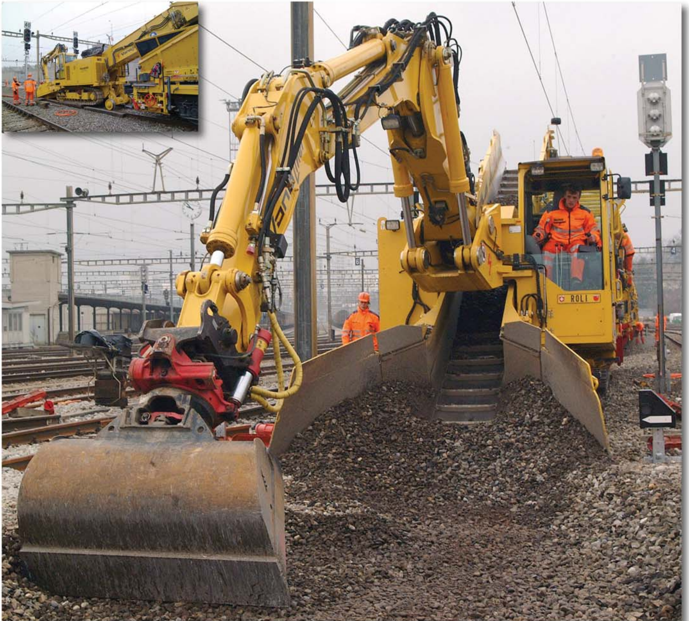
Die Ballast-Lademaschine Schaeff Typ ITC 312 VL2 mit dreiteiliger Arbeitseinrichtung in Ladeposition