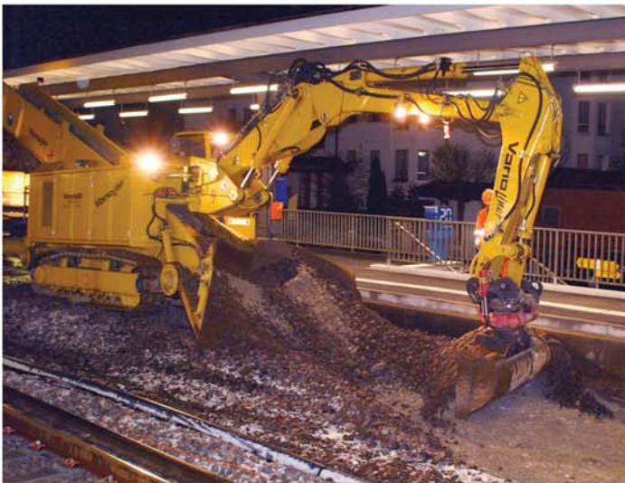
Geringer Platzbedarf dank integriertem Förderband