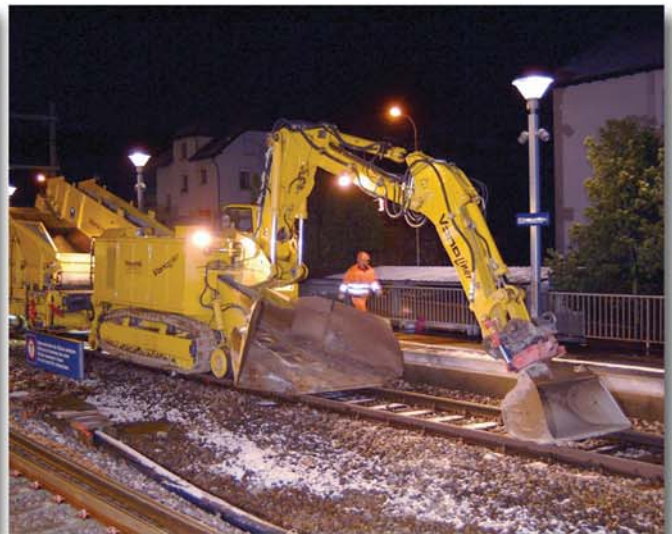
Genaues Arbeiten dank Roto-Tilt Einrichtung

Ballast-Lademaschine TEREX|SCHAEFF ITC 312 VL2