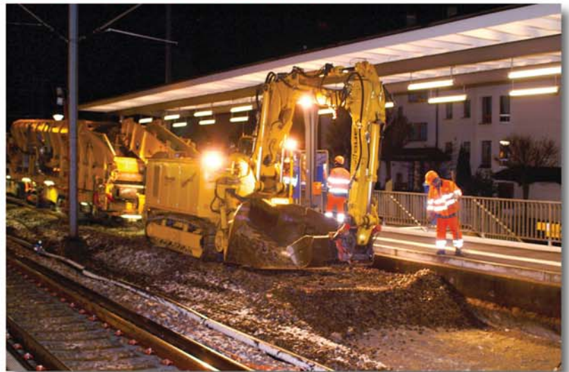
Hohe Ladekapazität dank Bandantrieb mit zwei Geschwindigkeiten