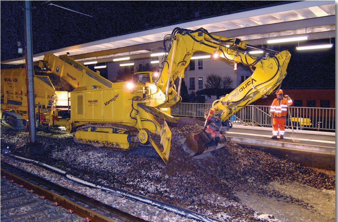
Die Ballast-Lademaschine Schaeff Typ ITC 312 VL2 mit dreiteiliger Arbeitseinrichtung in Ladeposition