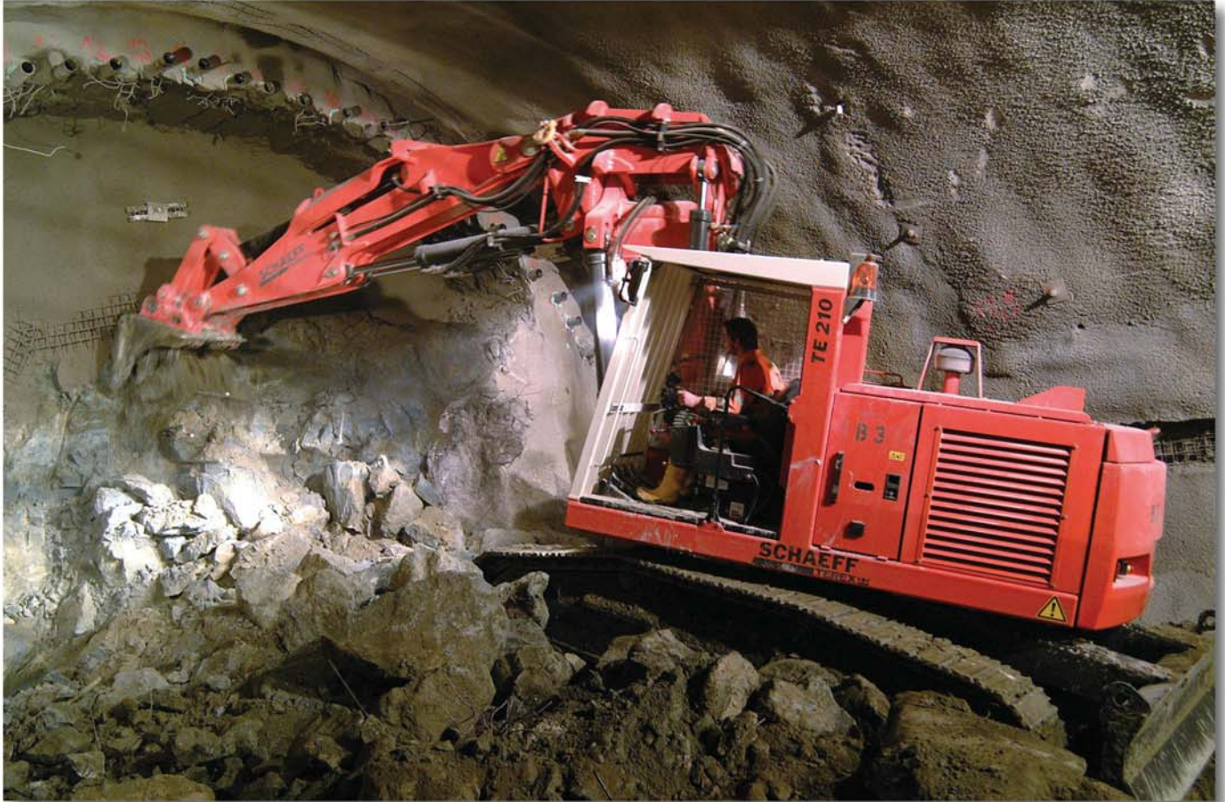
Der Tunnelbagger Typ TE 210 im Tunnelquerschnitt 37 m 2 , Firsthöhe 6 m